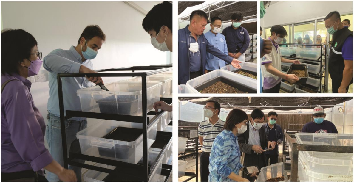
ภาพการดำเนินงาน

ลิงค์สนับสนุนโครงการ: https://www.facebook.com/FIN.CMU/